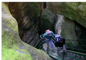
Die Orridi di Uriezzo