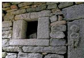
Gemeisselte Verzierung in Cuggina