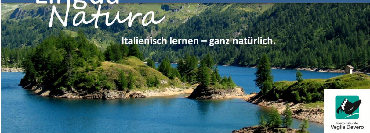
Deverosee, 1850 m