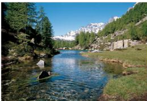
Hexensee 1760 m