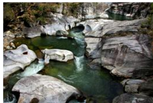
Marmite dei giganti