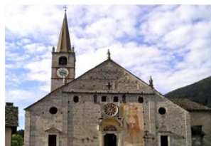
Die Kirche San Gaudenzio in Baceno