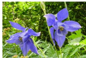
Alpenakelei, eine Seltenheit des Parks