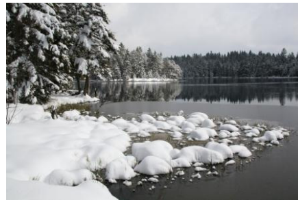
Der „Etang de Gruère“ im Naturpark Doubs

Die vier Naturparks werden am Ende des Sommers erfahren, ob sie im Januar 2013 in Betrieb gehen können.